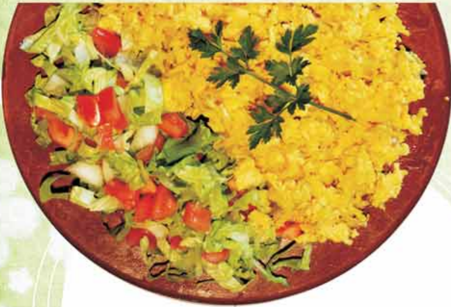
Lácara - Los Baldíos Provincia de Badajoz