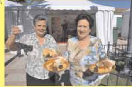
Día de la Mancomunidad

En octubre, los municipios de la mancomunidad ofrecen a todos los visitantes una degustación de comida popular (garbanzada) además, hay actuación de bandas, coros y danzas, verbena, pasacalles, etc. Para más información se puede llamar al Tel.: 924 416064.